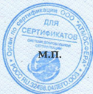
СХЕМА СЕРТИФИКАЦИИ: 1с (ГОСТ Р 53603-2009. Оценка соответствия. Схемы сертификации продукции в Российской Федерации).